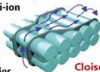
Cloison guide air

Le système de cloisons "guide d'air" unique des batteries Li-ion MAKITA associé au chargeur ventilé MAKSTAR prolonge la durée de vie des batteries.